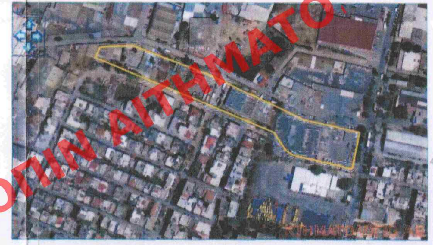
ΑΠΟΣΠΑΣΜΑ ΟΡΘΟΦΩΤΟΓΡΑΦΙΑΣ ΚΤΗΜΑΤΟΛΟΓΙΟΥ Α.Ε. ΚΑ: 1: 2500

ΔΕΣΜΕΥΟΜΕΝΑ ΤΜΗΜΑΤΑ ΙΔΙΟΚΗΣΙΑΣ ΔΕΣΜΕΥΟΜΕΝΟ ΤΜΗΜΑ ΓΙΑ ΤΗ ΔΗΜΙΟΥΡΓΙΑ ΚΟΙΝΟΧΡΗΣΤΟΥ ΧΩΡΟΥ - ΟΔΟΥ Ε (Α1,Α2,Α3,Β1,Β2,Β3,Β4,Α1) = 238.04 τμ ΔΕΣΜΕΥΟΜΕΝΟ ΤΜΗΜΑ ΓΙΑ ΤΗ ΔΗΜΙΟΥΡΓΙΑ ΚΟΙΝΟΧΡΗΣΤΟΥ ΧΩΡΟΥ - ΠΕΖΟΔΡΟΜΟΥ Ε (Α4,Β5,Β2,Β1,Α4) = 93.92 τμ ΔΕΣΜΕΥΟΜΕΝΟ ΤΜΗΜΑ ΓΙΑ ΤΗ ΔΗΜΙΟΥΡΓΙΑ ΚΟΙΝΟΧΡΗΣΤΟΥ ΧΩΡΟΥ - ΠΕΖΟΔΡΟΜΟΥ Ε (Β6,Α5,Β4,Β3,Β6) = 90.47 τμ ΣΥΝΟΛΙΚΑ ΔΕΣΜΕΥΟΜΕΝΗ ΕΠΙΦΑΝΕΙΑ ΙΔΙΟΚΗΣΙΑΣ: 238.04+93.92+90.47 = 422.43τ.μ ΠΙΝΑΚΑΣ ΣΥΝΤΕΤΑΓΜΕΝΩΝ ΠΙΝΑΚΑΣ ΠΛΕΥΡΩΝ Κορυφή X Y Μήκος Από Εως Μήκος Εμβαδόν A1 472867.20 4202777.01 A1 A2 20.68 A2 472886.39 4202769.35 A1 A4 6.18 A3 472905.32 4202762.00 A2 A3 20.31 A4 472892.61 4202721.38 A3 B1 5.16 A5 472894.71 4202742.96 A4 B1 31.35 B1 472901.39 4202756.79 A4 B5 3.00 B2 472900.93 4202757.64 A5 B4 30.11 B3 472857.88 4202770.17 A5 B6 3.00 B4 472865.08 4202771.23 B1 B2 3.00 B5 472865.73 4202728.53 B2 B3 34.95 B6 472857.48 4202741.81 B2 B5 31.26 B3 B4 3.00 B3 B6 30.20